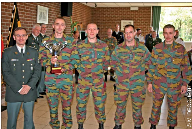
Le Lieutenant-colonel BEM J. ROBRECHTS, Comd Kamp BEVERLO, remet le Prix du Commandant de la Composante Terre à l'équipe AESOR

1. Gent - 2. AESOR - 3. Limburg 2 - 4. Waasland - 5. Vlaams Brabant 2