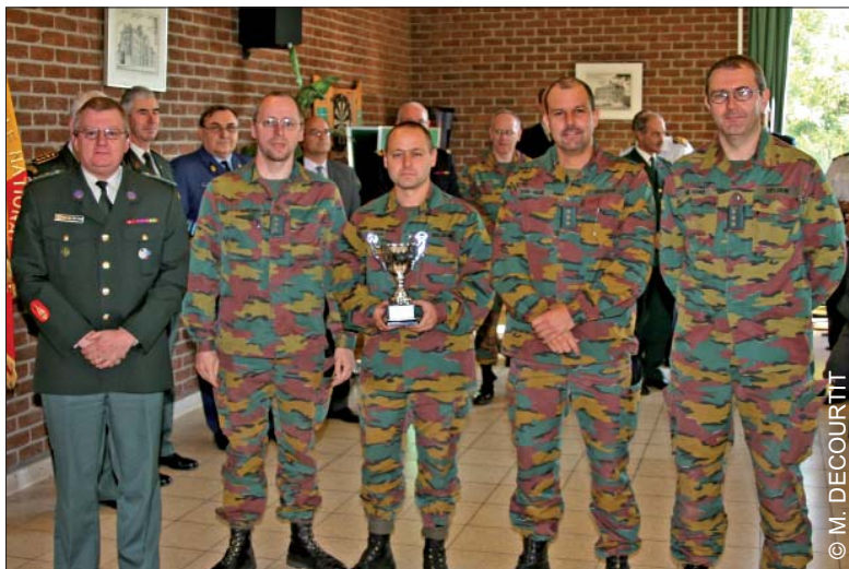
Kolonel SBH R. VAN DER MEEREN, Nationale Directeur van de Reserve, overhandigt de Prijs van DNR aan de ploeg WAASLAND

1. Waasland - 2. Vlaams Brabant 2 - 3. Gent - 4. Limburg 2 - 5. Nieuwe Hoop