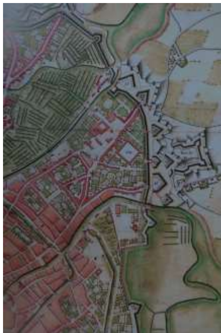
1756, I.B. Malfaisson Uittreksel stadsplan met Montereyfort (midden rechts) en kazerne N° 1 (nr. 170 links naast) Extrait plan de la ville avec fort Monterey (milieu droit) et caserne N°1 (n°170 à côté à gauche)

1782 werd het afgebroken. Later, in 1830 werd op die plek de Citadel van Gent, gebouwd in opdracht van Willem I, in gebruik genomen. Zij werd in 1909 afgebroken om plaats te maken voor de Wereldtentoonstelling van 1913.