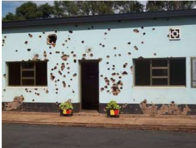
Het memoriaal in Kigali Le mémorial à Kigali